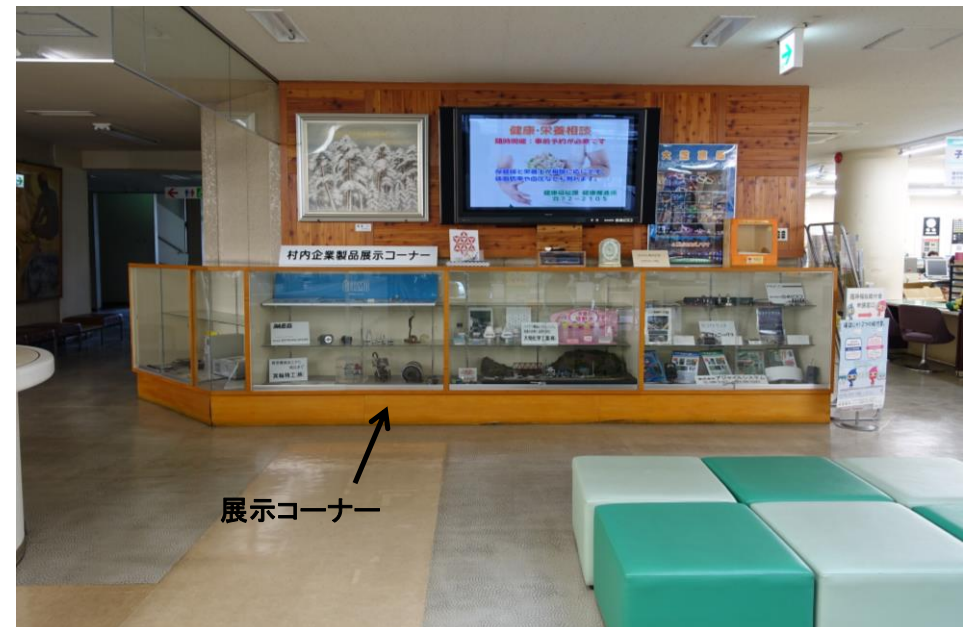
展示コーナーイメージ