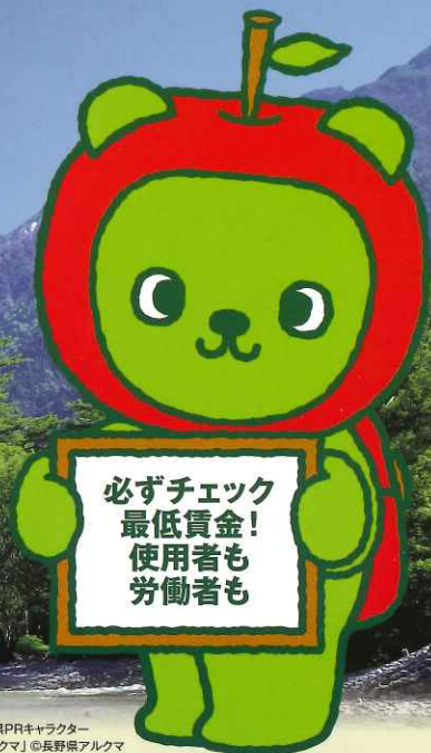
長野県PRキャラクター「アルクマ」©長野県アルクマ

★なお、下記の産業で働く労働者には、それぞれの特定(産業別)最低賃金が適用されます。