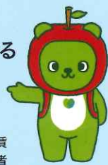
長野県PRキャラクター「アルクマ」©長野県アルクマ

※印刷・製版業は、令和元年12月31日以降の改定がないので、長野県最低賃金877円が適用されます。